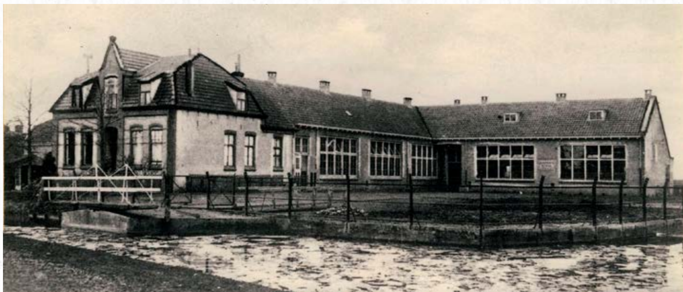
De St.-Ignatiuschool in de jaren twintig van de vorige eeuw. We zien hier de nieuwe vleugel, die in een later stadium is verhoogd.

Na 1984 vonden diverse groeperingen en verenigingen tijdelijk onderdak in de school. De toekomst van het schoolgebouw was jarenlang onderwerp van gesprek op het gemeentehuis van Alkemade. Tenslotte werd besloten tot de oprichting van de Stichting Ignatius die vanaf 1990 verantwoordelijk is voor het beheer van het gebouw. Muziekvereniging Liefde voor Harmonie, kinderdagverblijf 't Zonnestraaltje en Stichting Jouv Alkemade (SJA) waren de eerste huurders. Met de komst van de Stichting Muziekonderwijs Leiderdorp (MOL) in 2005 en de verhuur van oefenruimte aan bandjes is de vroegere school overwegend een muziekgebouw geworden waar het onderwijs is teruggebracht tot muzieklessen.