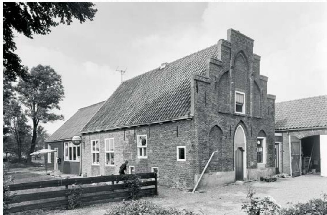
Het rechthuis in de jaren 50 met de bierstal als café - terras. Op het dak staat een oude tv-antenne.