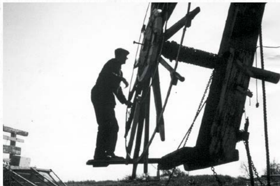
Willem op de kruibank van Lijkermolen 1.

Naast molenaar van Lijkermolen 1 werd Willem van der Pouw Kraan toen ook machinist van de motor in de Lijkermolen 2. Om het 'karige' molenaarsloon aan te vullen, werd er bij Lijkermolen 1 ook vee gehouden door Willem, zoals wat melkkoeien en een paar varkens. Rond 1951 kregen de Lijkermolens fokwieken en Willem wist altijd zo mooi te verwoorden hoe geweldig daar de molens van opgeknapt waren. Bij een klein 'trekkie' ging de molen al aan de gang.