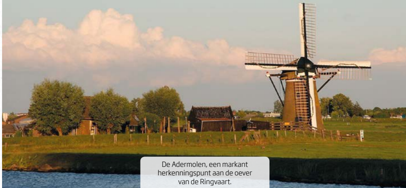
De Adermolen, een markant herkenningspunt aan de oever van de Ringvaart.