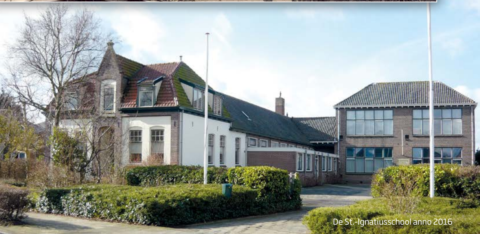
De St.-Ignatiuschool anno 2016