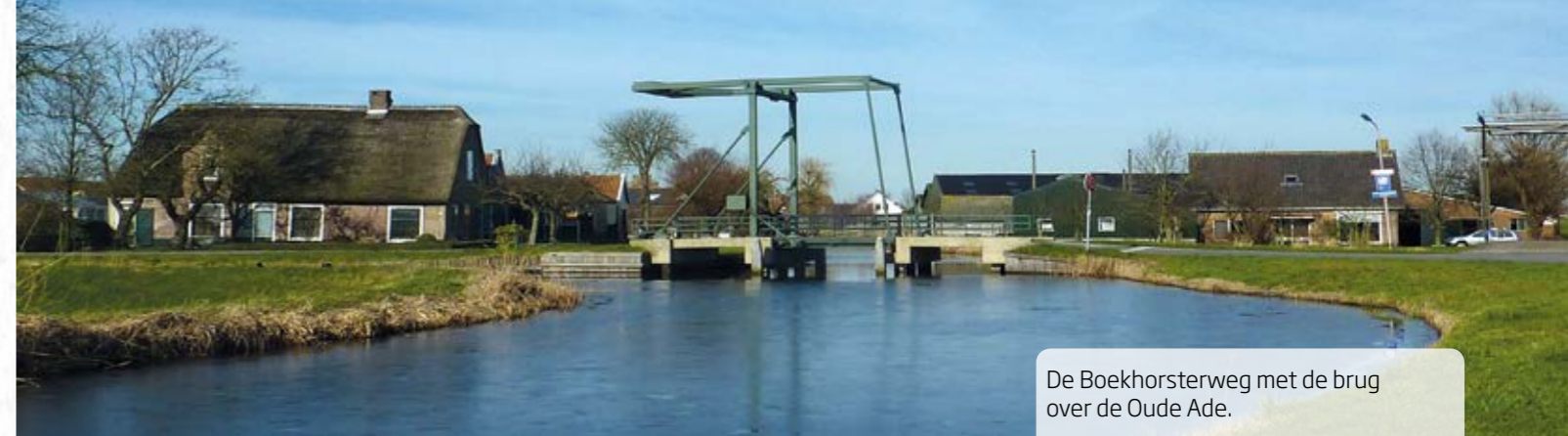
De Boekhorsterweg met de brug over de Oude Ade.