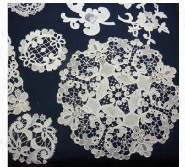
Naaldkant in diverse vormen en afmetingen.