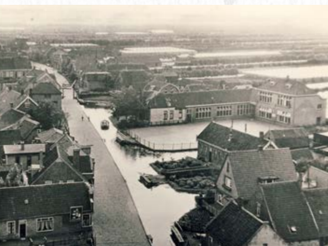
Genomen vanuit de kerktoeren, nu met de verhoging op de aangebouwde vleugel.