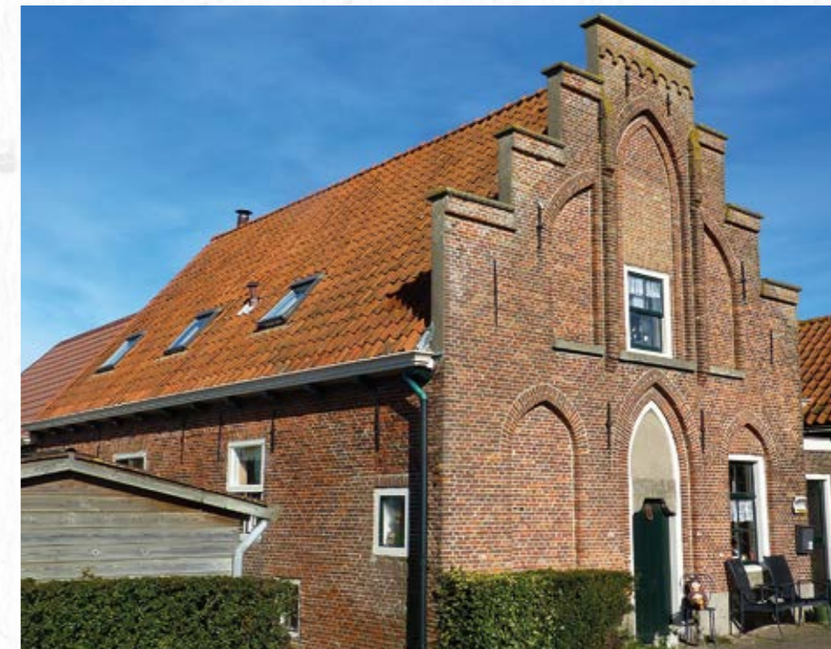
Het rechthuis zoals het er nu bij staat.

Door een kennelijk misverstand was de buurtschap op 1 januari 1812 als gemeentelijke exclave (een stuk land dat bestuurlijk bij een bepaald gebied hoort, maar hier geografisch niet mee verbonden is) ingedeeld bij de gemeente Noordwijkerhout, waaro.a. de Hoge Boekhorst deel van uitmaakte. De Vrije en Lage Boekhorst werd in 1817 hiervan losgemaakt en een zelfstandige gemeente. Dit hield in dat ze een eigen college van B&W, een gemeenteraad, een secretaris en een ontvanger kreeg. Het gebiedje had een oppervlakte van slechts 35 ha en ongeveer 60 inwoners. De bestuurders van de Vrije en Lage Boekhorst kwamen bijeen in het rechthuis aan de Boekhorsterweg. De nieuwe gemeentewet van 1851 bepaalde dat gemeenten waarvan het aantal kiezers minder dan 25 was, opgeheven moesten worden. Er werd een commissie in het leven geroepen om de gemeente Vrije en Lage Boekhorst op te heffen en met de gemeente Alkemade samen te voegen. In de tussentijd werden de burgemeester en de secretaris van Alkemade tot burgemeester en secretaris van de Vrije en Lage Boekhorst benoemd. Bij wet van 12 juli 1855 werd de gemeente Vrije en Lage Boekhorst opgeheven en bij Alkemade gevoegd.