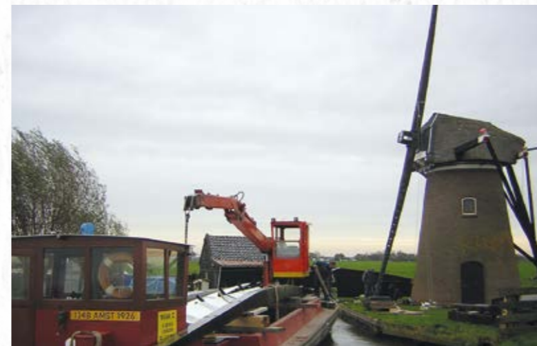
De Adermolen in restauratie, 2005.

In 1985 kwam er een nieuw elektrisch gemaal en de molen werd in 1986 door waterschap De Oude Venen overgedragen aan de Rijnlandse Molenstichting. Gerrit Vermeij bleef gewoon het gemaal bedienen, maar het meeste water werd er waarschijnlijk toch door de molen uitgeslagen.