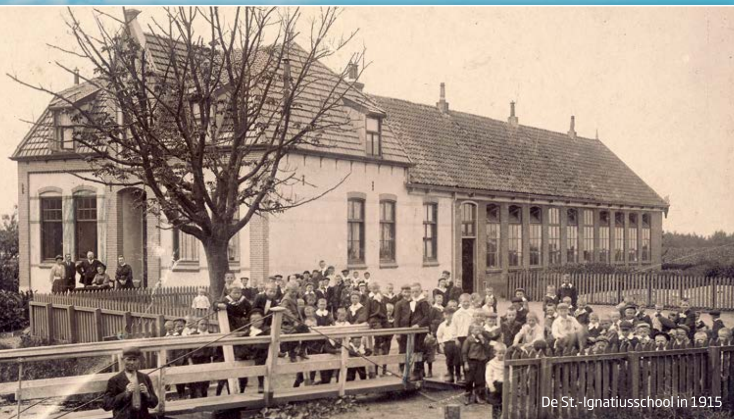
De St.-Ignatiuschool in 1915

100 jaar St.-Ignatiuschool › Klokkenroof tijdens de Tweede Wereldoorlog De Mater Amabilis School › Het Armenfonds van de Boekhorst