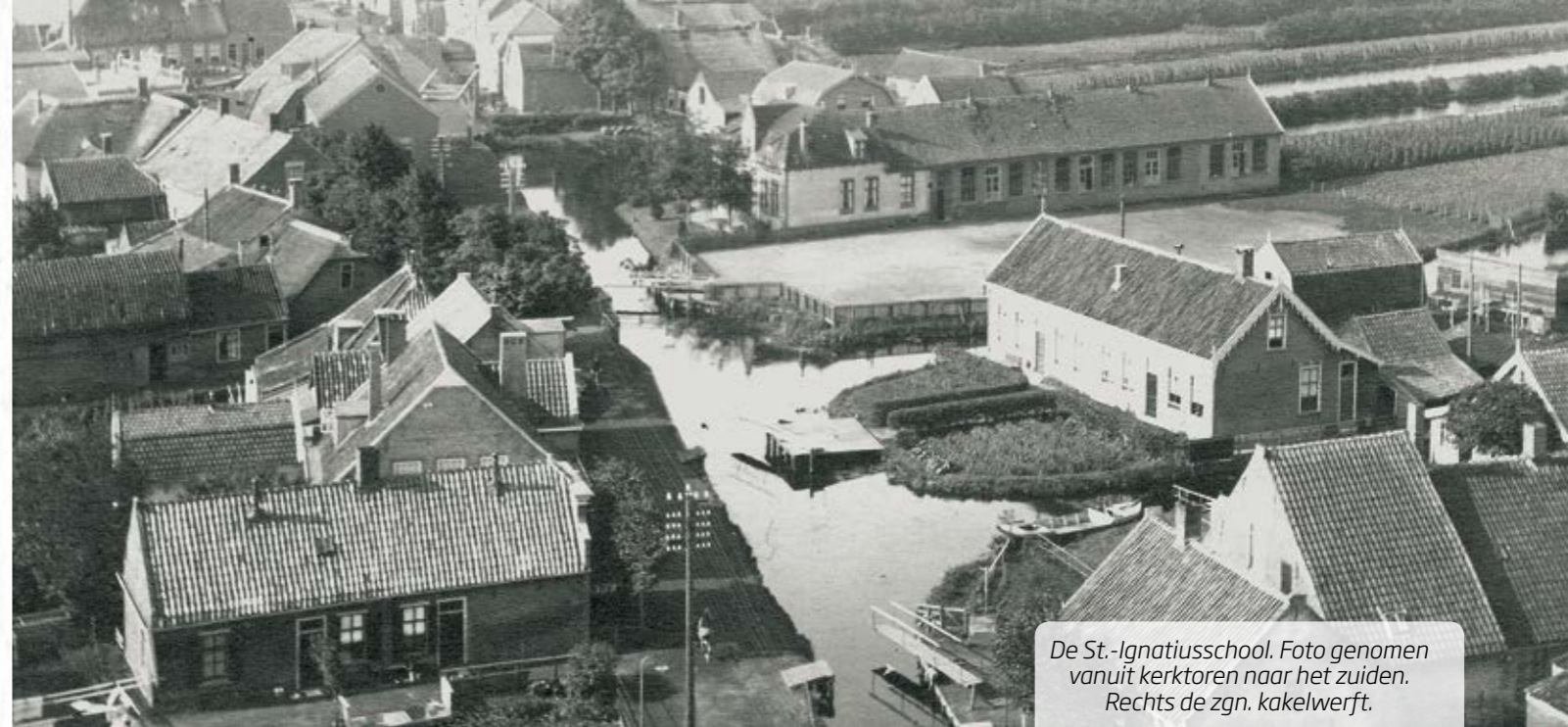
De St.-Ignatiuschool. Foto genomen vanuit kerktoren naar het zuiden. Rechts de zgn. kakelwerft.