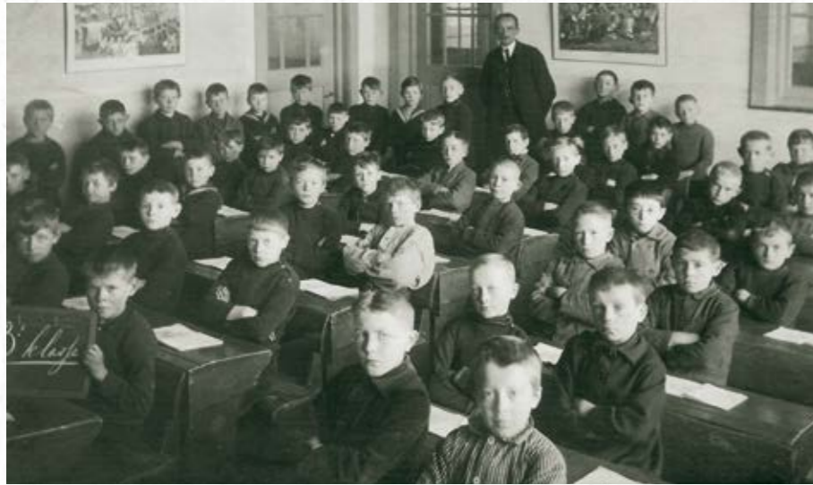
Een schoolfoto uit 1923 met bijna vijftig jongens. Op het bord is nog net te zien dat het een '3e klasje' is.

voldoen en welke vakken verplicht gegeven moesten worden.