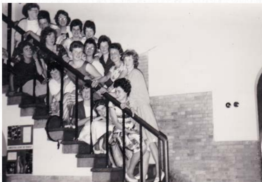
Cursisten van de MAS in de huishoudschool te Langeraar bij het afscheid in juli 1962. Het was de eerste lichtung die na drie jaar 'afstudeerde'.