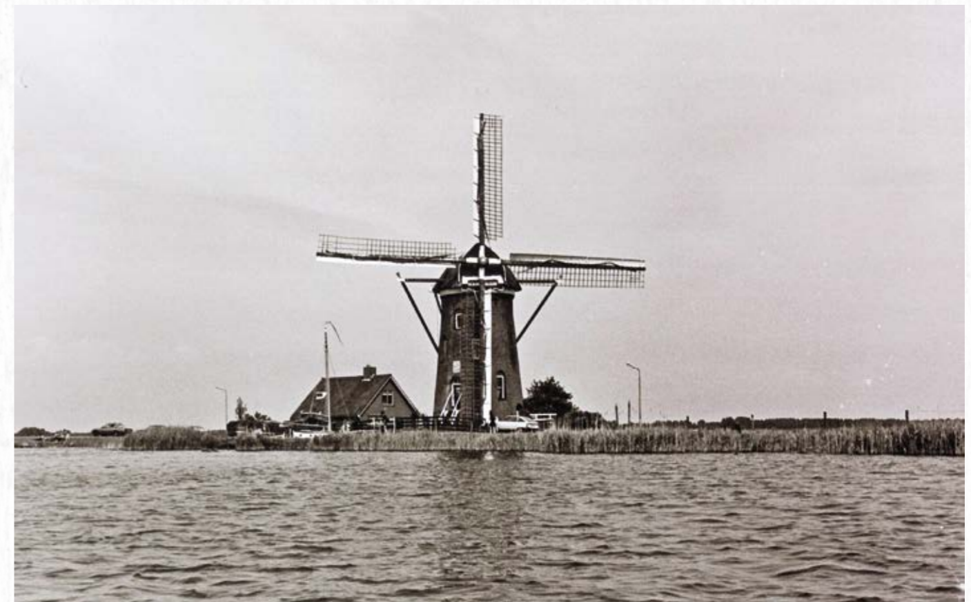
De Lijkermolen 1 gezien vanaf de Kleipoel, omstreeks 1973. De molen heeft fokwieken. Aan de noordkant van de molen is de in 1970 nieuw gebouwde molenaarswoning te zien.