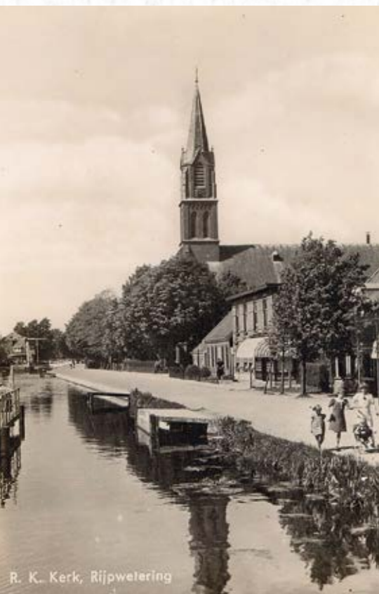
R. K. Kerk, Rijpwetering

Kort na de bevrijding werd er in juni 1945 een bevrijdingsoptocht gehouden. Creatief als de Veenders in dit soort zaken waren en zijn, werd op gepaste wijze een 'corso-kar' gemaakt met daarop een kopie van de gestolen kerkklokken. De tekst op de kar (zie pag. 6) liet aan duidelijkheid niets te wensen over.