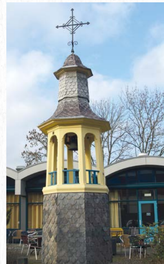
Het torentje van het oude Huize Jacobus met de Angelusklok voor het nieuwe Huize Jacobus.